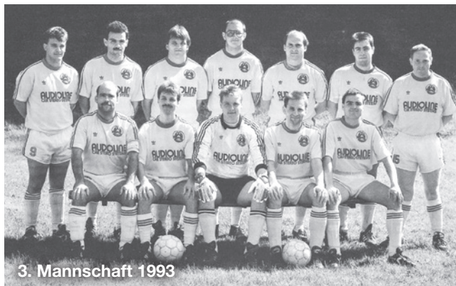
3. Mannschaft 1993