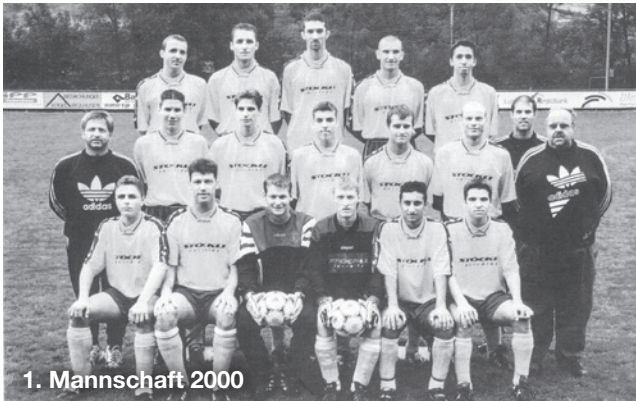
1. Mannschaft 2000