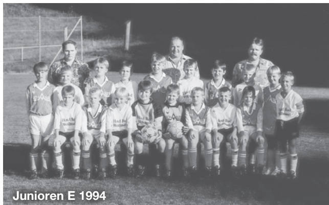
Junioren E 1994