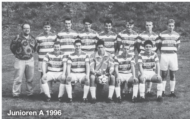
Junioren A 1996