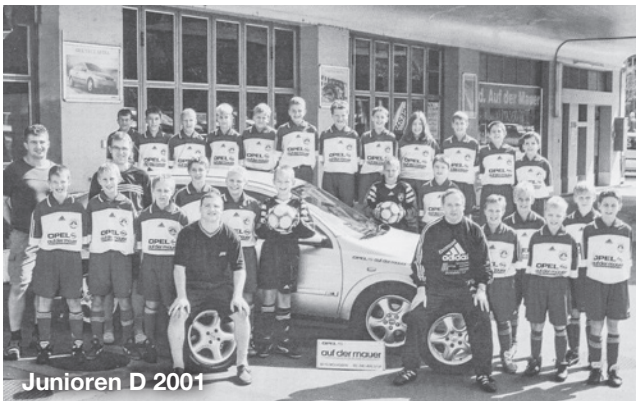
Junioren D 2001