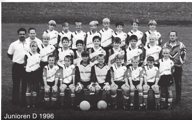
Junioren D 1996