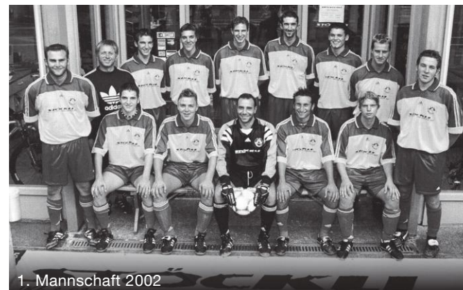
1. Mannschaft 2002