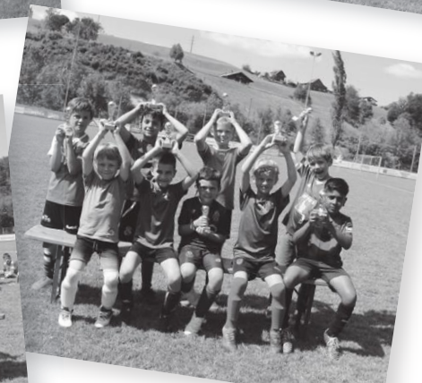
Sieger Kat. D - Die Fussballhaie