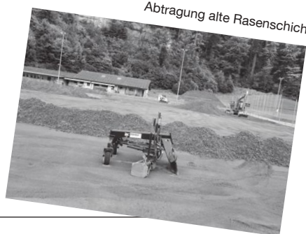
Abtragung alte Rasenschicht