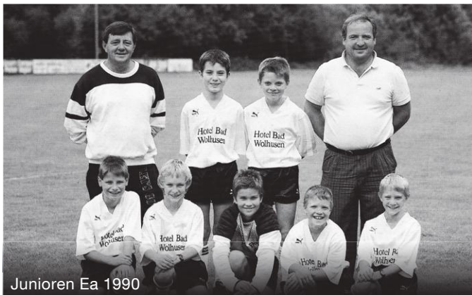
Junioren Ea 1990