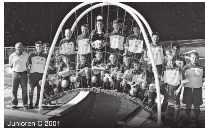
Junioren C 2001