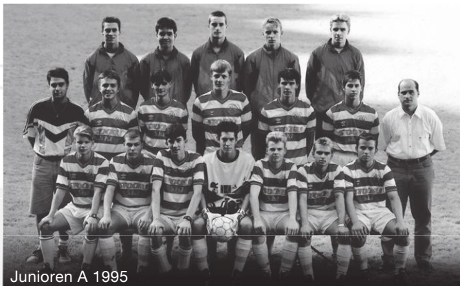
Junioren A 1995