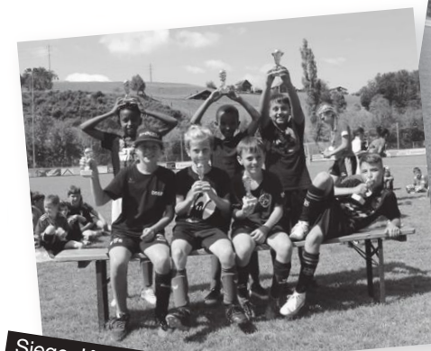
Sieger Kat. C - Teufelskicker